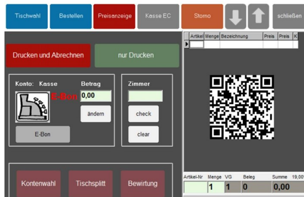
Abbildung 2: Anzeige des QR-Codes in der Positionsliste

Code erzeugt und in der Positionsliste angezeigt (Abbildung 2). Dieser kann auf einem angeschlossenen Ausgabemedium (wie z.B. ein angeschlossenes Kundendisplay, vgl. Abbildung 3) angezeigt werden.