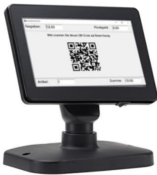
Abbildung 3: QR-Code auf Kundendisplay

Hinweis: Alle gängigen Mobilgeräte verwenden das Android-Betriebssystem (z.B. Samsung) oder das iOS-Betriebssystem (Apple iPhone). Die Vorgehensweise zum Scannen von QR-Codes hängt vom jeweiligen Endgerät ab. Einige neuere Geräte können QR Codes direkt mit der Kamera scannen, während ältere Modelle noch eine separate QR-Code-App benötigen. Diese erhalten Sie kostenlos im Google PlayStore / Apple App Store.