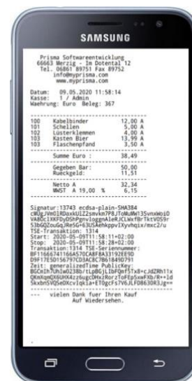
Abbildung 4: Rechnung auf Mobilgerät