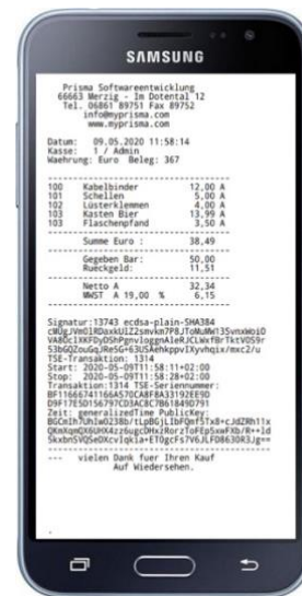
Abbildung 4: Rechnung auf Mobilgerät