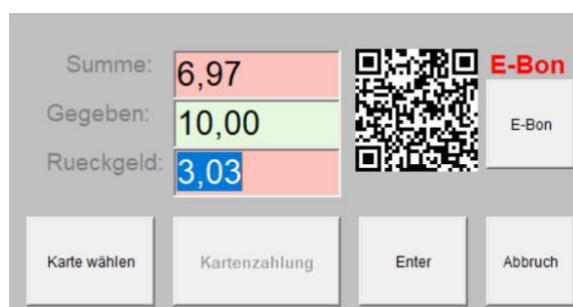
Abbildung 2: Rückgabedialog

Nach Bestätigung der Zahlung über den Button „Enter“ wird dann eine pdf-Datei erzeugt und im Internet zum Download bereitgestellt. Gleichzeitig wird aus dem Link zum erzeugten Dokument der QR-Code erzeugt und im Rückgabedialog angezeigt (Abbildung 2). Dieser kann auf einem angeschlossenen Ausgabemedium (wie z.B. ein angeschlossenes Kundendisplay, vgl. Abbildung 3) angezeigt werden.